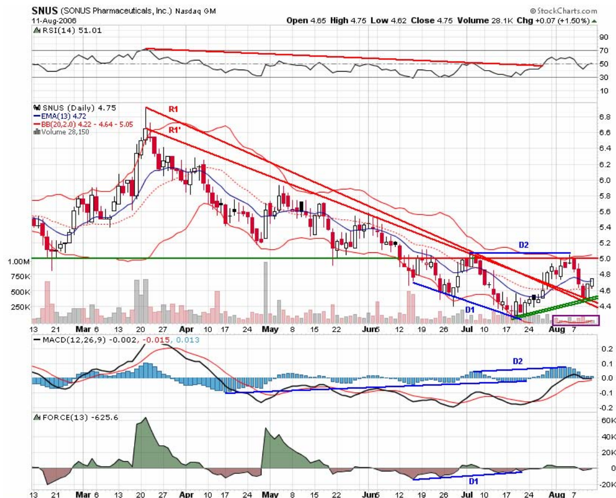
Figuur 10.2 Sonus Pharmaceuticals, Inc (SNUS).

Eén iets doet ons op deze grafiek nog denken dat de nieuwe trend alsnog zijwaarts zou kunnen zijn en dat is de divergentie tussen prijs en MACD histogram, aangegeven door de blauwe lijntjes D2. MACD histogram ging bij de tweede top een stuk hoger, maar de prijs haalde nagenoeg slechts hetzelfde niveau als de voorgaande top. Dit zou kunnen duiden op het feit dat het klimaat nog niet gunstig genoeg is voor een echte stijgende trend en de groeipijnen ervan zich zullen laten gelden in een zijwaartse trend. Vooral het gebrek aan volume kan hier nog roet in het eten strooien. Optimisten als we zijn hebben we echter meer oog voor alle bovenvermelde punten die hier toch wel het voordeel van de twijfel geven aan een stijgende eerder dan een zijwaartse trend. Vooral de hogere bodem sterkt ons vertrouwen hierin. Maar zoals altijd is het aan ons om geduld te hebben tot de prijs laat blijken wat het zal worden. Het ziet er in elk geval temidden een troosteloos beurslandschap een kleurrijk grafiekje uit. Eenmaal het aandeel er in zou slagen een hogere top neer te zetten dan is de stijgende trend een feit (bovendien werd dan ook de eerstvolgende grote